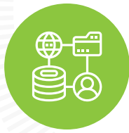
Penetración del marco