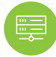
Penetración de host interno