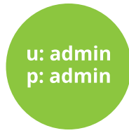
Explotación de credenciales débiles