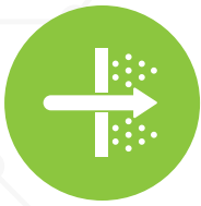
Prueba de Penetración Completa

RidgeSecurity está cambiando este juego con RidgeBOT, este es un robot inteligente de validación de seguridad. RidgeBOT se presenta como un robot con conocimiento colectivo de amenazas, vulnerabilidades y exploits, y está equipado con técnicas de piratería de última generación. Además, permite automatizar las pruebas de penetración, lo que lo hace asequible con la capacidad de ejecutarse a escala. Trabaja dentro de un alcance definido y se replica instantáneamente para abordar estructuras altamente complejas.