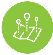
Perfiles de activos